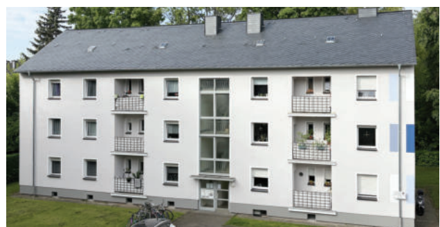
Zurmaiener Straße, Erneuerung Dach und Fassade