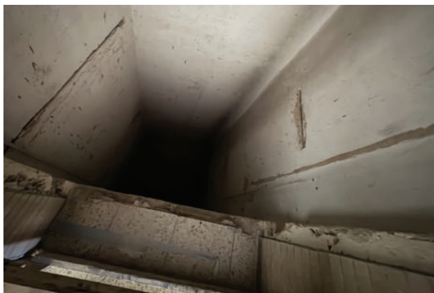
Benediktinerstraße 64 und Weidengraben 48-52, Erneuerung Aufzugsanlage

Die Umsatzerlöse betragen im Geschäftsjahr T€ 8.505 (Vj. T€ 8.274). Hierin enthalten sind Erlöse aus der Vermietung von Wohnraum von T€ 6.542 (Vj. T€ 6.440). Die Veränderung resultiert aus moderaten Anpassungen der Mietpreise bei Neuvermietung von Bestandswohnungen an den zum 01.07.2023 fortgeschriebenen Mietpiegel der Stadt Trier.