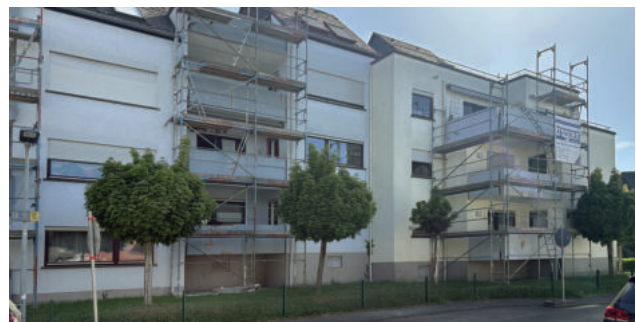
Bachstraße 22-24, Balkonsanierung