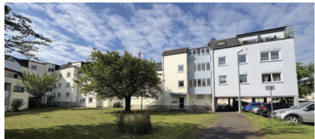
Bachstraße 22-24, Erneuerung Fenster

Im Bereich der Nebenkosten werden sich nach einem Zeitraum der Erholung die wieder gestiegenen Energiepreise bemerkbar machen. Die insbesondere durch die Konflikte in Nahost im Jahr 2025 wieder höheren Energiepreise führen bei der Abrechnung im Jahr 2026 wieder zu einer spürbaren Energiepreissteigerung. Die Entwicklung bei den warmen, aber auch der kalten Betriebskosten bleiben weiterhin ein wesentlicher Faktor in der Steigerung der Bruttomiete.